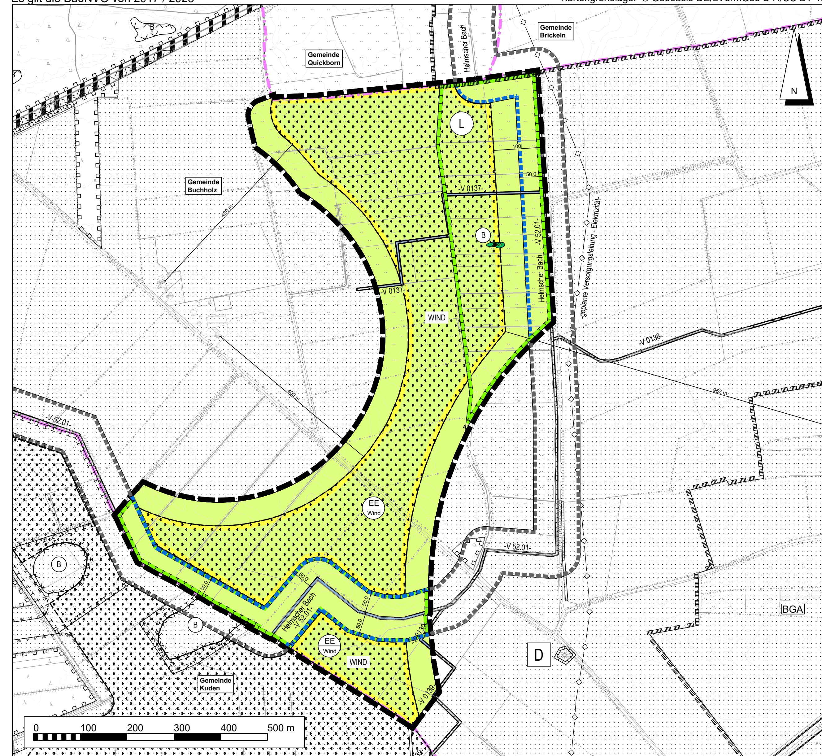
Kreis Dithmarschen - Gemeinde und Gemarkung Buchholz - Flur 1, Flur 2, Flur 14

Maßstab 1 : 5.000