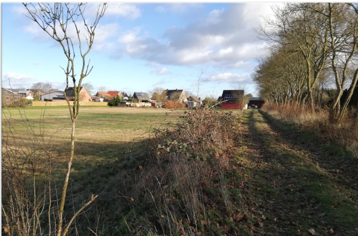
Blick auf den nördlichen Teil des Plangebietes an der Eddelaker Straße (L 138) und nördlich des Friedhofes