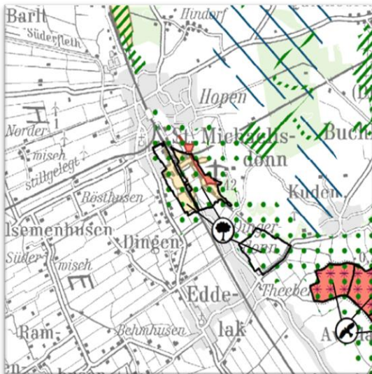
Abbildung 2: Ausschnitt aus dem LRP zum Planungsraum III (2020) – Hauptkarte 1

Gemäß Hauptkarte 1 zum Landschaftsrahmenplan (LRP) für den Planungsraum III befinden sich östlich des Plangebietes in etwa 600 m Entfernung und südlich in etwa 4 km Entfernung zwei Bestandteile des FFH-Gebietes „Klev- und Donnlandschaft bei St. Michaelisdonn“ (DE 2020-301).