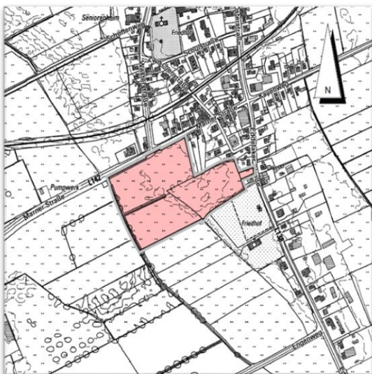
Abbildung 1: Geltungsbereich des B.-Planes Nr. 46

Der rund 4,0 ha große Geltungsbereich des Bebauungsplans Nr. 46 liegt am südwestlichen Rand der Ortslage St. Michaelisdonn. Das Gebiet befindet sich aktuell in landwirtschaftlicher Nutzung als intensiv genutzte Weidefläche.