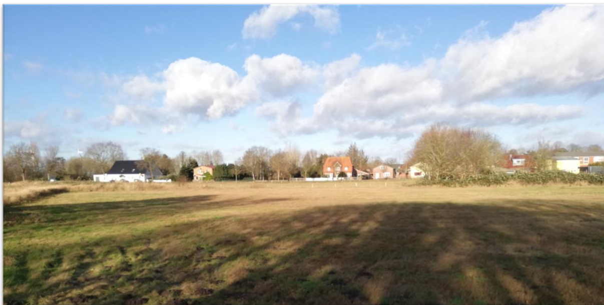
Blick auf den nördlichen Teil des Plangebietes an der Marner Straße (L 142)