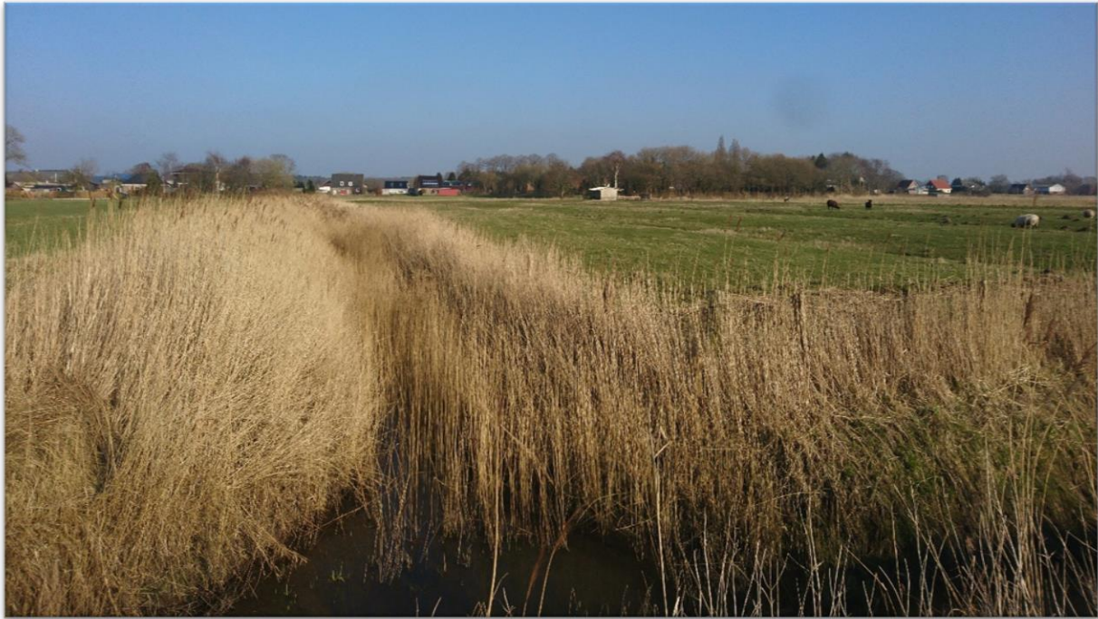
Blick auf den südlichen Teil des Plangebietes mit Röhrichtbiotop (§) und Gruppenstruktur