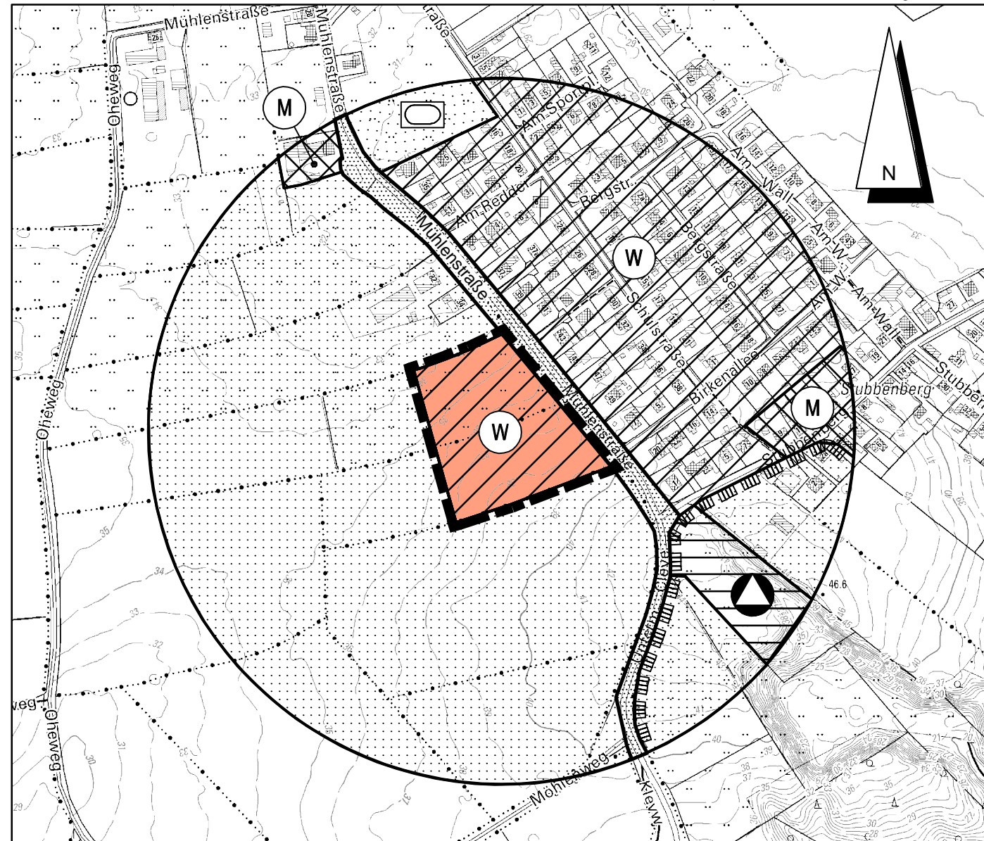
Kreis Dithmarschen - Gemeinde und Gemarkung Buchholz - Flur 13 und 6

DTK5 © LVermGeo SH (www.LVermGeosh.Schleswig-Holstein.de)